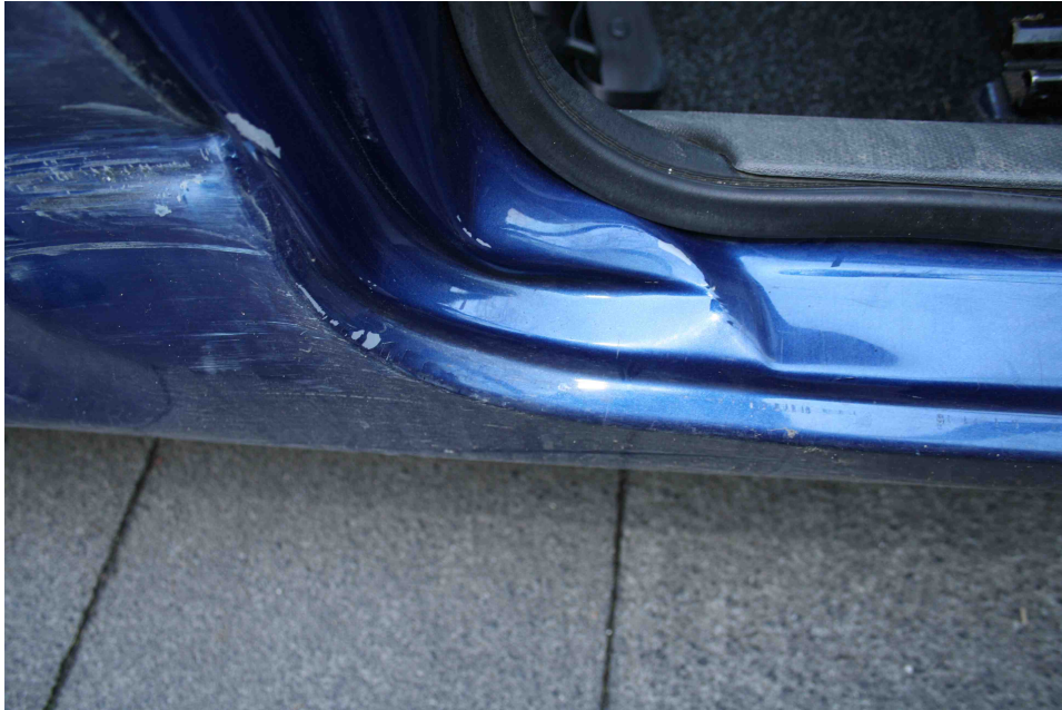
Bild 11: Der rechte Türschweller wurde stark verformt und beschädigt.