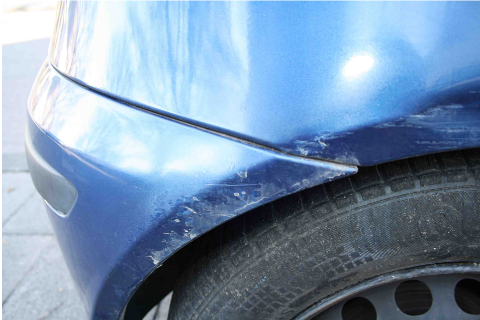
Bild 15: Die Lackierung des hinteren Stoßfängers wurde beschädigt.