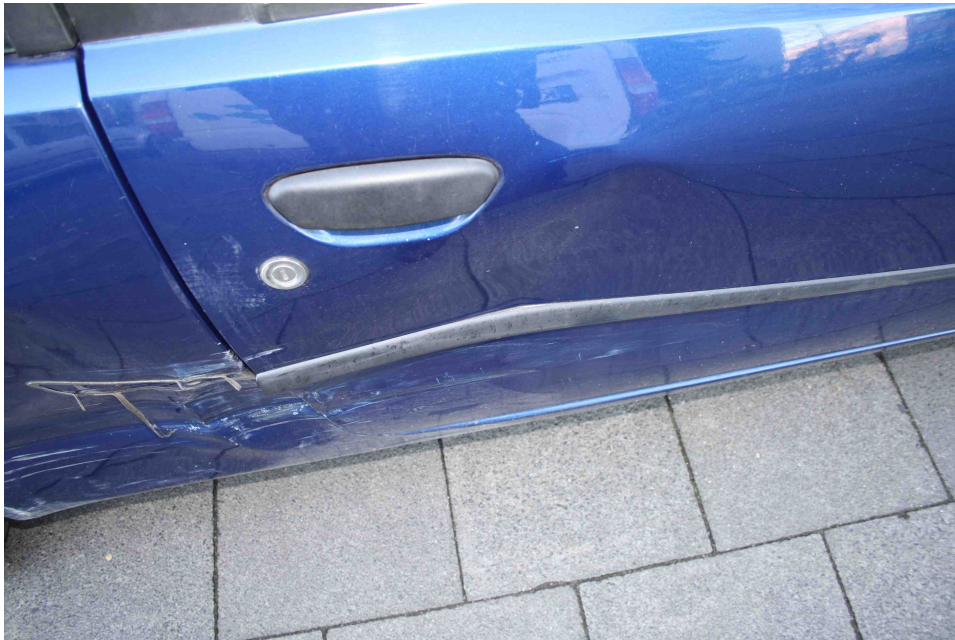
Bild 9: Die rechte Tür wurde stark ins Fahrzeuginnere eingedrückt und beschädigt.