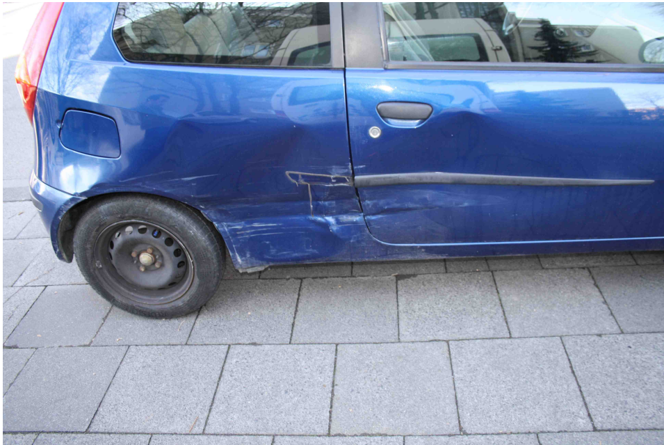
Bild 3: Das Fahrzeug wurde von der rechten Seite pressend und streifend breitflächig ins Fahrzeuginnere eingedrückt.